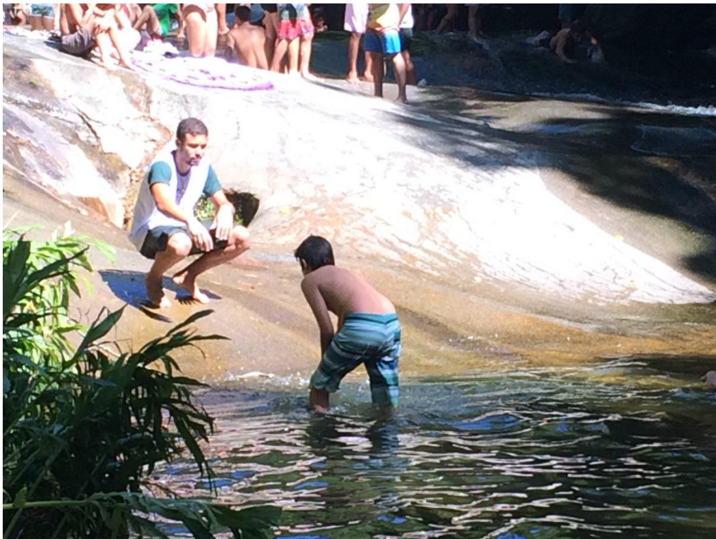
Rua José de Jesus Junior, S/N° - Sítio Bocaina – Sana – CEP 27995-000 – Macaé - RJ