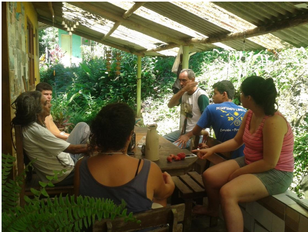
Rua José de Jesus Junior, S/N° - Sítio Bocaina – Sana – CEP 27995-000 – Macaé - RJ