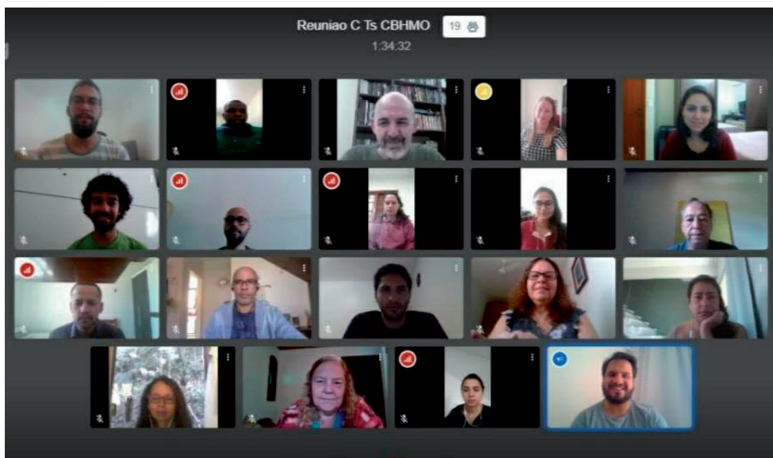
Criação do Grupo de Trabalho foi proposta em reunião das Câmaras Técnicas

Também houve debate sobre o Fórum Água e Juventude. O evento anual, realizado pelo Comitê para reunir jovens da bacia hidrográfica em torno da conservação dos recursos hídricos, tinha sua próxima edição programada para setembro de 2020 e precisará de adequações, que deverão ser feitas tanto no cronograma como no modelo de atividades.