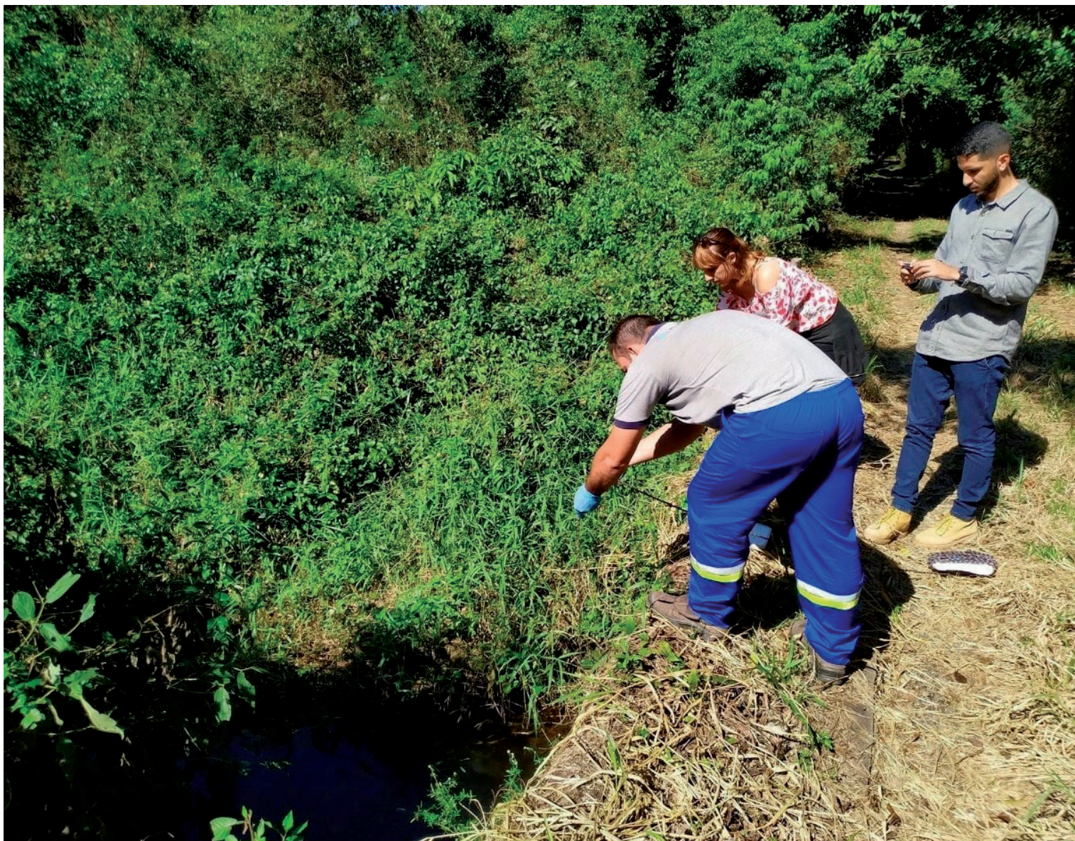
Projeto de monitoramento de recursos hídricos vem sendo feito pelo Comitê desde o ano passado

As Câmaras Técnicas do Comitê de Bacia Hidrográfica dos rios Macaé e das Ostras tiveram reuniões conjuntas no dia 24 de julho, por videoconferência. A pauta contou com temas da Câmara Técnica Institucional Legal (CTIL), da Câmara Técnica de Instrumentos de Gestão (CTIG) e da Câmara Técnica de