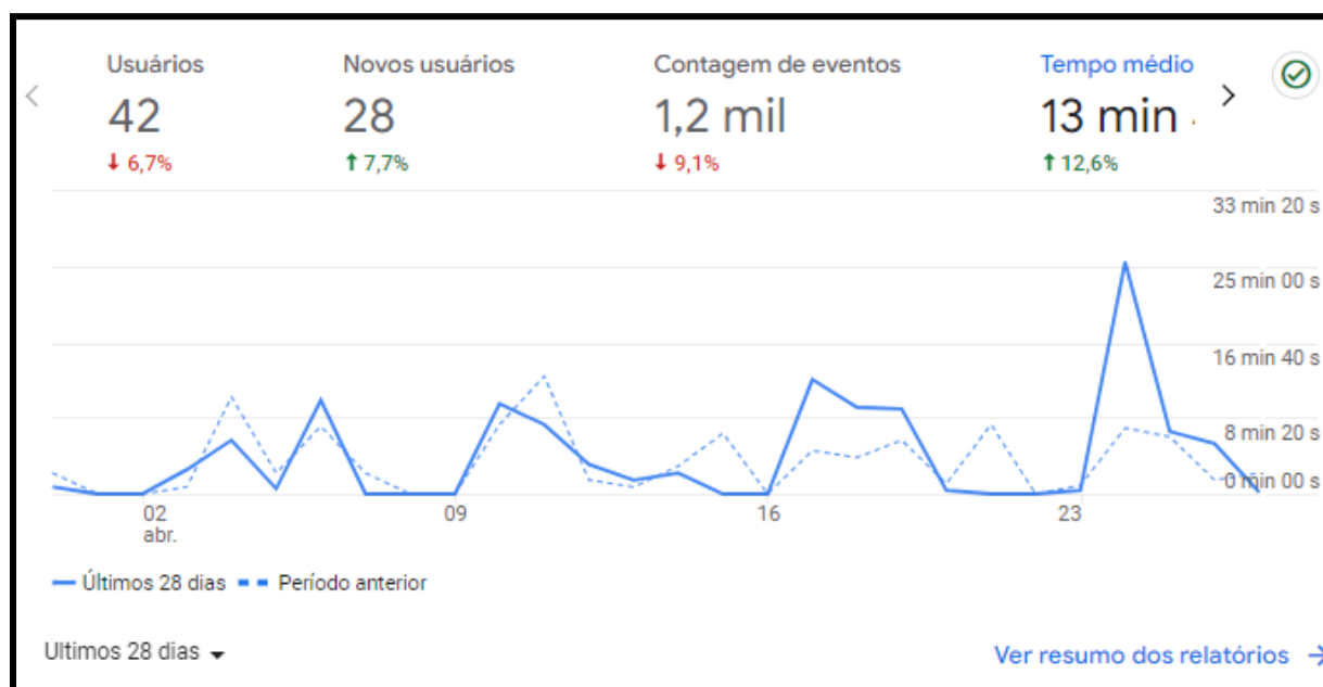
Figura 1: Gráfico retirado do Google Analytics

Esses números são demonstrados na figura 1 abaixo, por um gráfico retirado do Google Analytics que mostra a variação do número de usuários que acessaram o sistema.