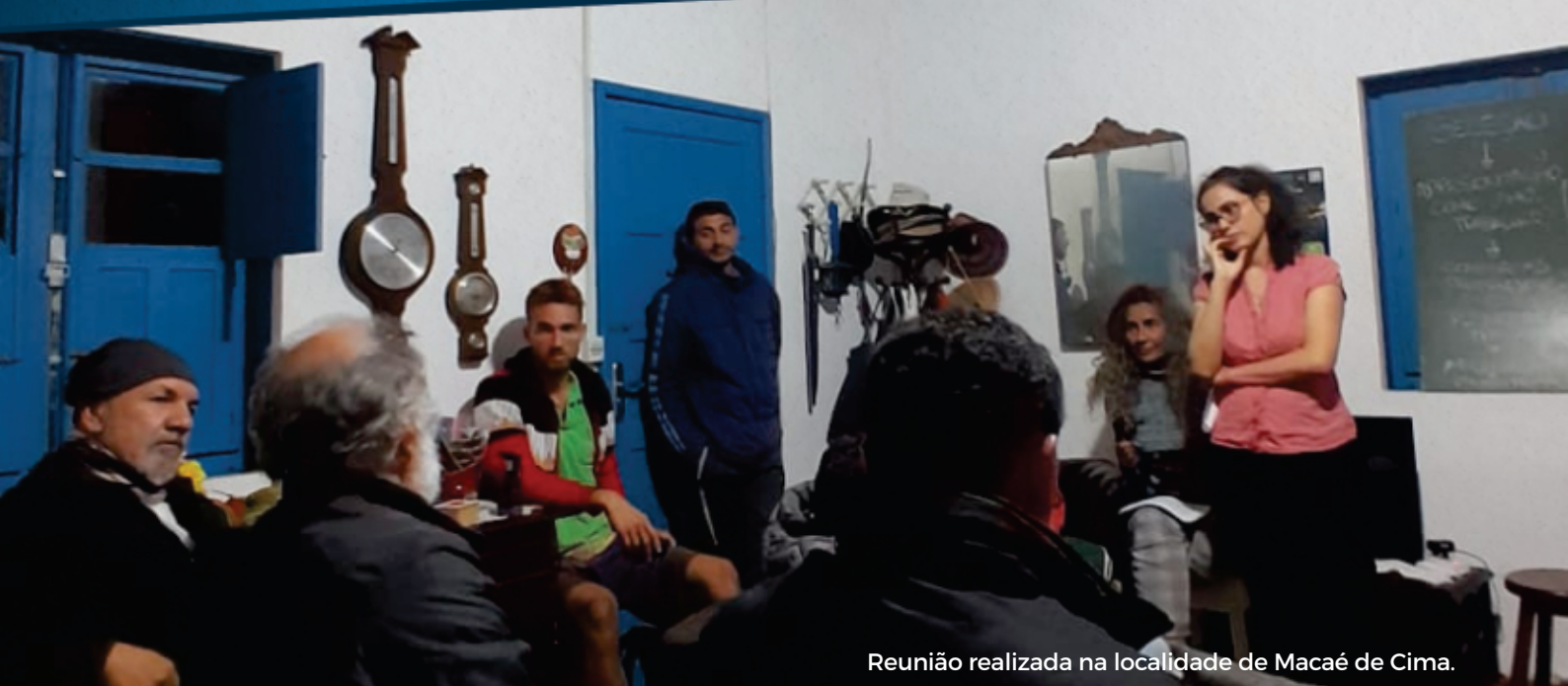
Reunião realizada na localidade de Macaé de Cima.