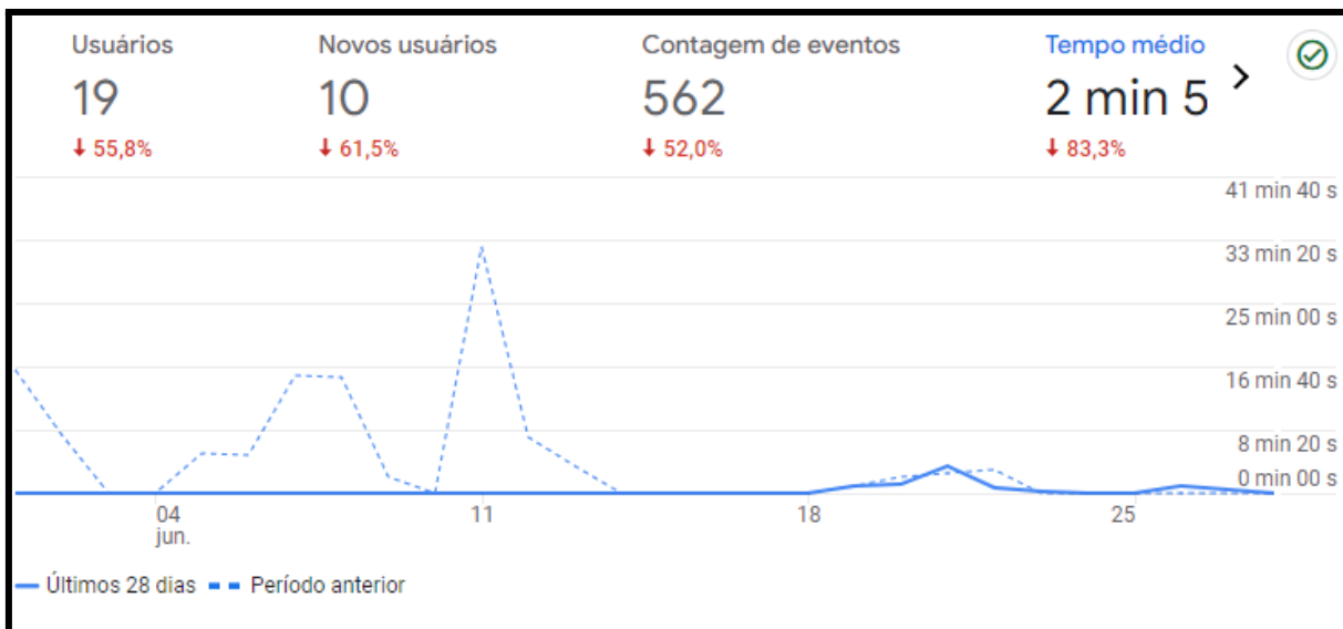
Figura 1: Gráfico retirado do Google Analytics

Os acessos de usuários por cidade também estão disponíveis no Google Analytics. Os usuários acessaram o SIGA Macaé de 10 cidades diferentes. A figura 2 mostra o gráfico com acessos por cidades. As figuras 3 apresentam a tabela de usuários por cidade com acesso de novos usuários, sessões engajadas, taxa de engajamento e sessões engajadas por usuário.