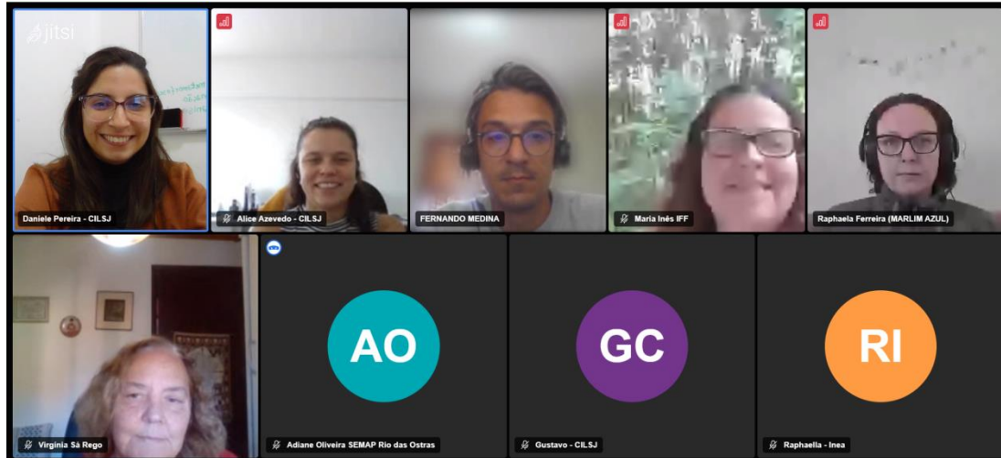
Figura 1: Reunião Ordinária do GT Revisão do Plano em 04/08/2023.