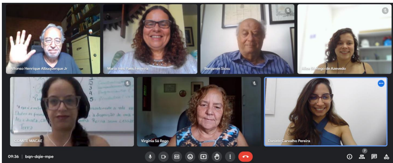
Figura 1: Registro da Reunião Extraordinária do GT PSA e Boas Práticas em realizada em 04 de dezembro de 2023.