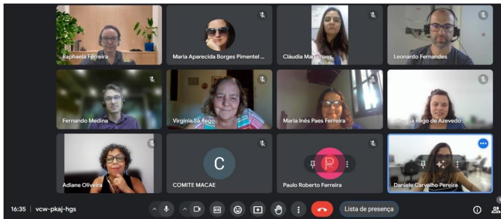
Figura 1: Registro da reunião GT Revisão do Plano em 20 de junho de 2024.