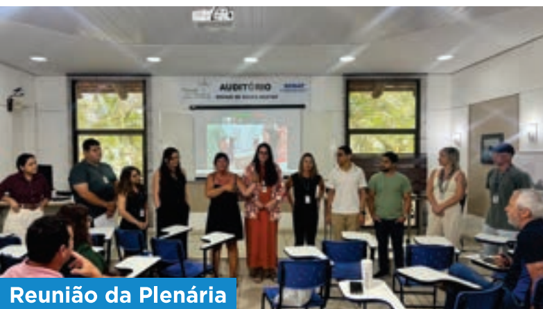
Reunião da Plenária