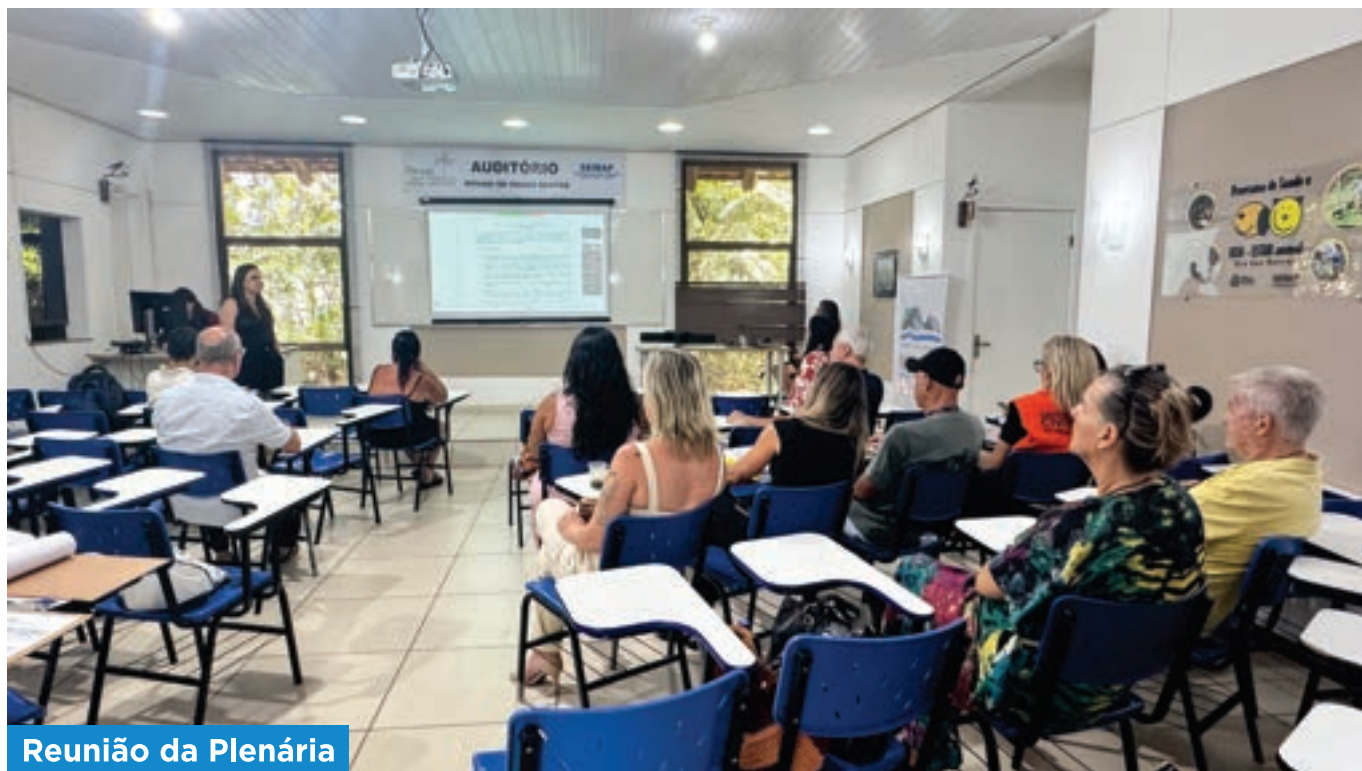
Reunião da Plenária