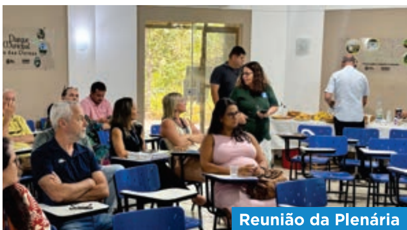
Reunião da Plenária