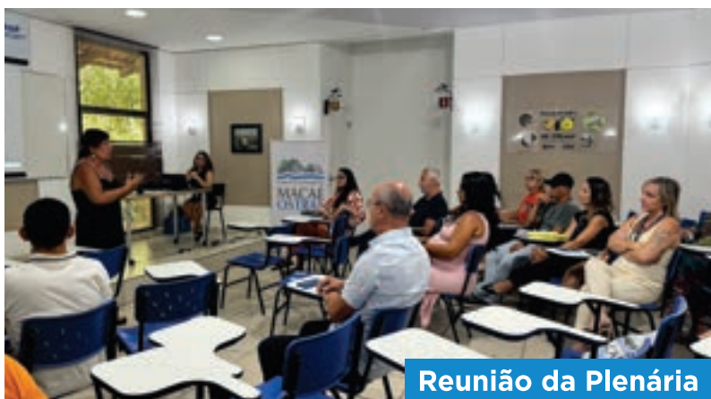
Reunião da Plenária