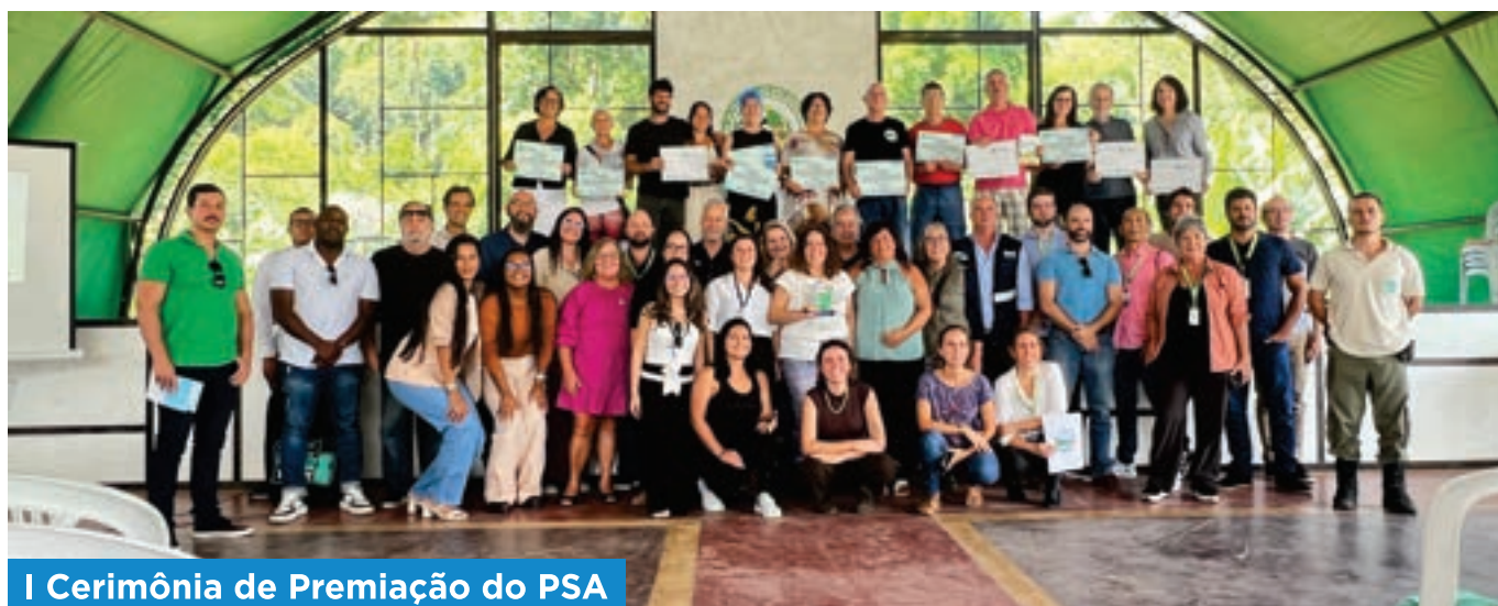
I Cerimônia de Premiação do PSA

Em momento oportuno, o CBH Macaé Ostras divulgará uma nova data para a realização da cerimônia de premiação, cumprindo o objetivo de valorizar os provedores de serviços ambientais e de fortalecer ações de conservação dos recursos hídricos na Região Hidrográfica VIII.