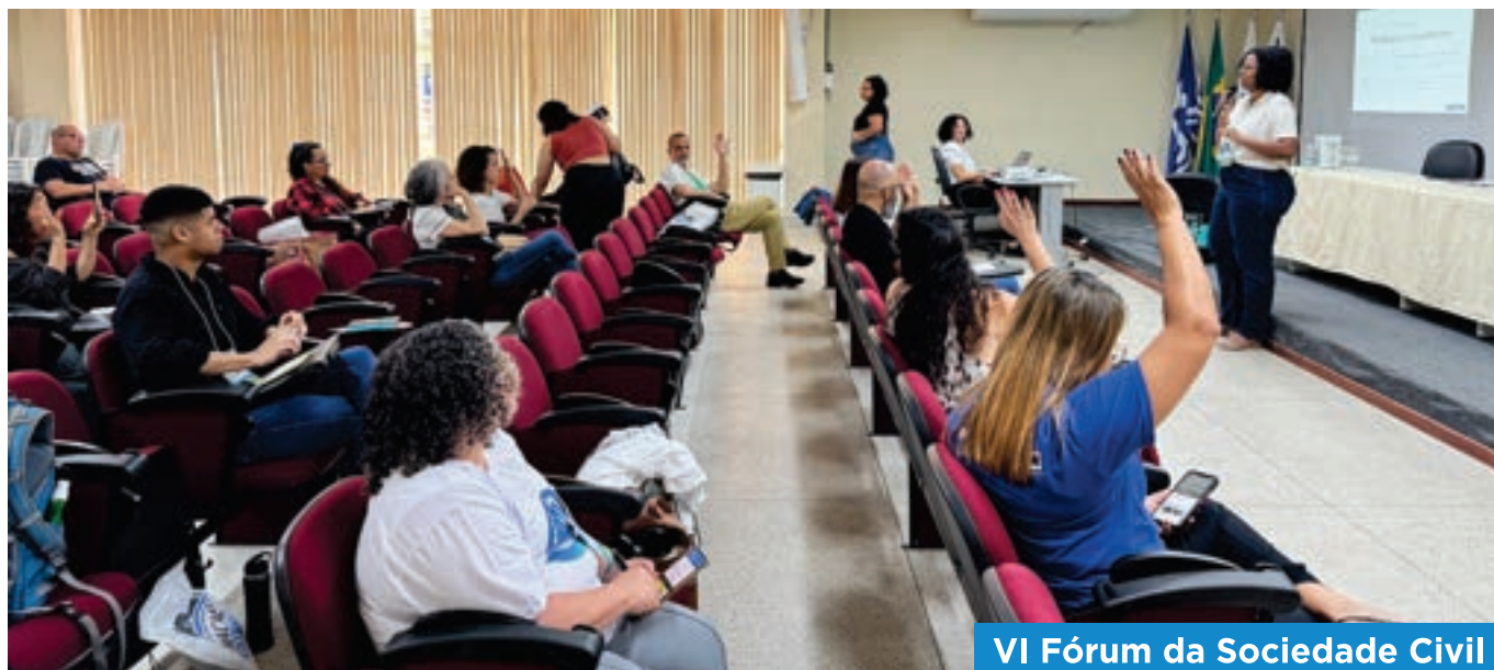
VI Fórum da Sociedade Civil

O GT Movimentos e Coletivos terá como atribuições promover a mobilização e inclusão desses grupos na gestão dos recursos hídricos, ampliar o acesso à informação sobre políticas públicas do setor, fortalecer o entendi-